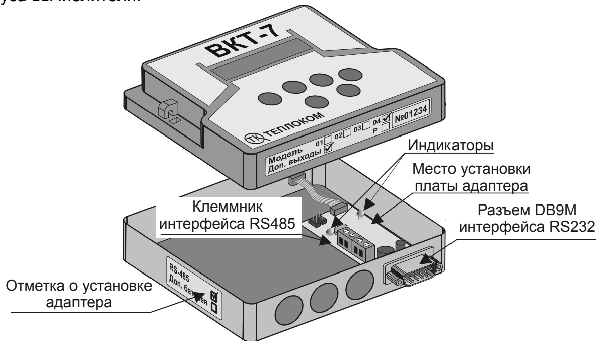
Рис. 1 – Место установки платы универсального адаптера интерфейса

При установке адаптера делается соответствующая отметка на боковой стенке корпуса вычислителя.